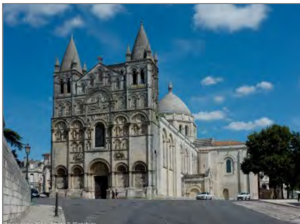
Cathédrale Saint Pierre

Faites un petit tour en ville .... Et venez NOMBREUX