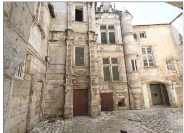
Hôtel Saint Simon