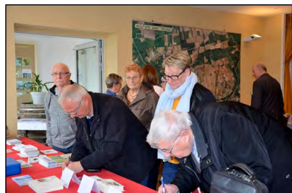
À l'accueil, les souvenirs attendaient les visiteurs