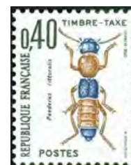
TRA : les timbres-taxe insectes / coléoptères

Pascal Bandry a dressé le bilan des demandes d'abonnements gratuits 2019 :