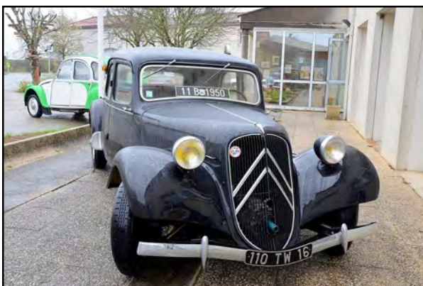
Devant la salle des Fêtes une 2CV et une traction avant accueilleraient les visiteurs.