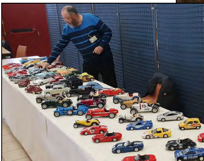
Collectionneur de voitures miniatures