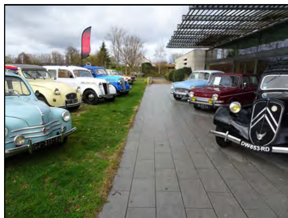
Les voitures exposées