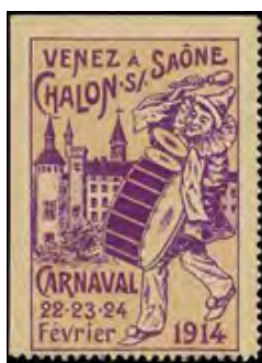
COV : Carnaval !