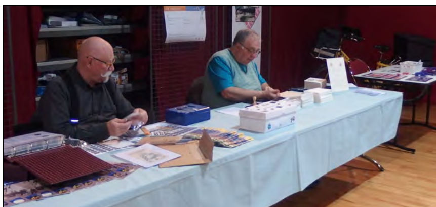
Un stand avec des souvenirs pour les visiteurs