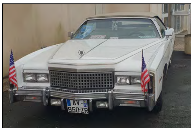
La belle Américaine