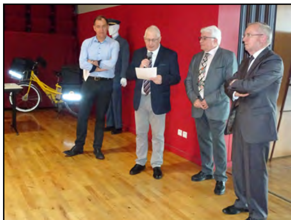
L'inauguration avec le discours