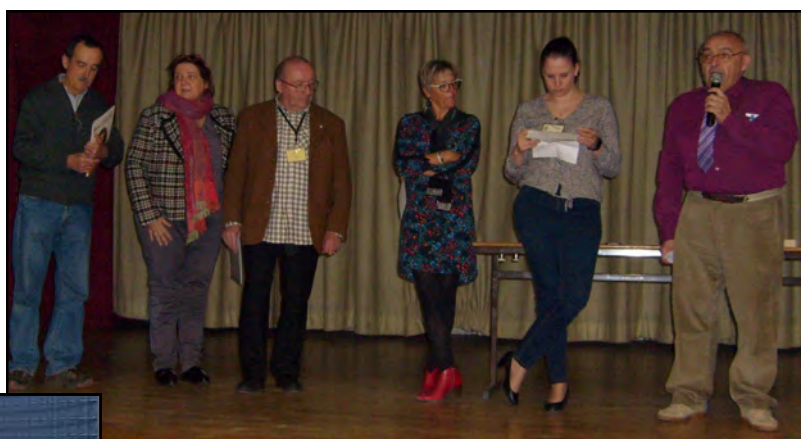
Proclamation des résultats des compétiteurs