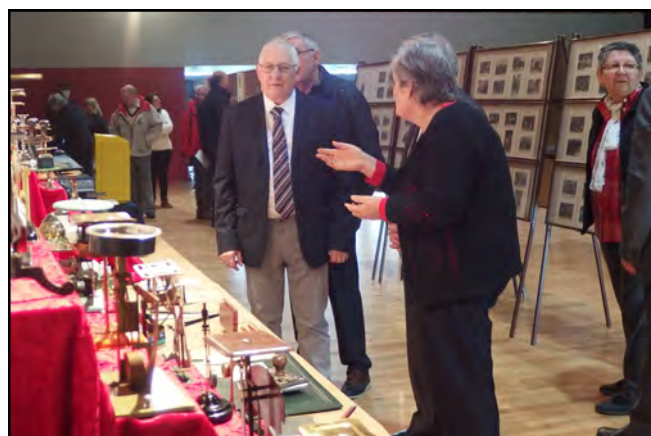
Un stand avec des pèse-lettres