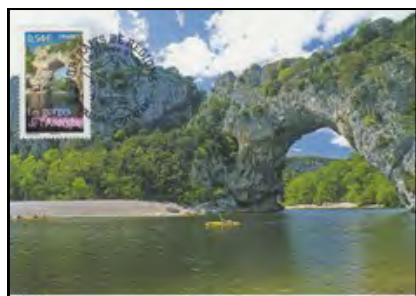
MAX : promenade au fil de l'eau