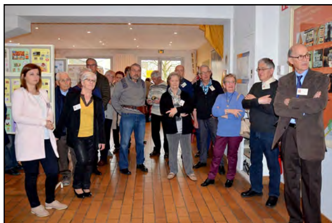
Une partie de l'assistance attentif pendant le discours d'accueil et avant le vin d'honneur offert par la mairie.