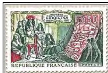
THE : A l'époque de Louis XIV