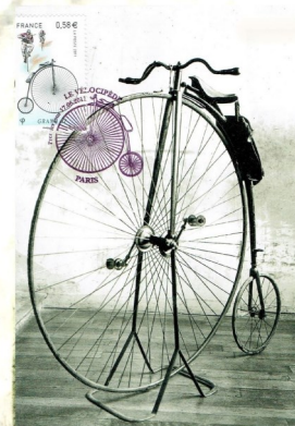
Le grand bi, l'un des documents projetés.

Dimanche 15 septembre , à 10 h, local de l'APCF (ancien collège Viè-